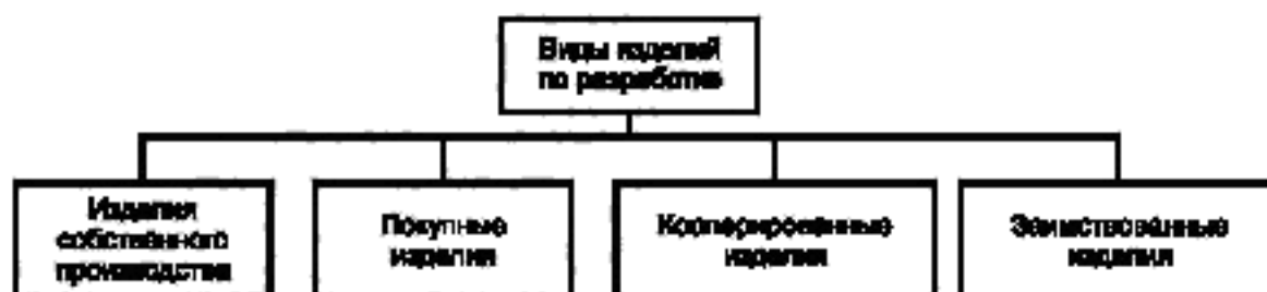
Рисунок А.3 — Виды изделий по разработке

А.3 Виды и структура изделий по разработке приведены на рисунке А.3.