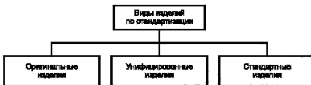
Рисунок А.5 — Виды изделий по стандартизации

А.5 Виды изделий по уровню стандартизации приведены на рисунке А.5.