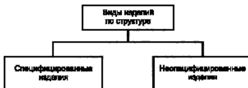
Рисунок А4 — Виды изделий по структуре

А.4 Виды и структура изделий по структуре приведены на рисунке А.4.