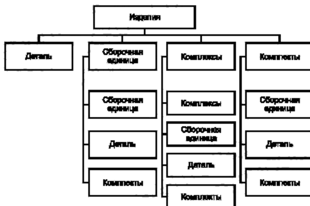
Рисунок А.1 — Виды и структура изделий по конструктивно-функциональным характеристикам

А.1 Схема видов изделий по конструктивно-функциональным характеристикам и их структура приведены на рисунке А.1.